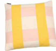
8232 | 30 50 x 50 cm (S. / P. 21)