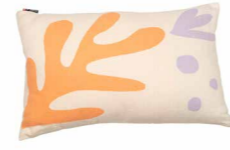
8234 | 60 40 x 60 cm (S. / P. 22)