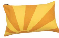
8231 | 35 40 x 60 cm (S. / P. 24)