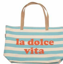
9839 | 57 64 x 40 cm (S. / P. 4)