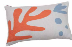
8234 | 21 40 x 60 cm (S. / P. 23)