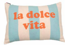
8228 | 57 40 x 60 cm (S. / P. 5)