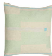
8236 | 51 50 x 50 cm (S. / P. 16)