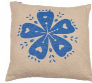
8230 | 22 50 x 50 cm (S. / P. 12)