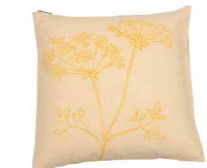
8233 | 31 50 x 50 cm (S. / P. 19)