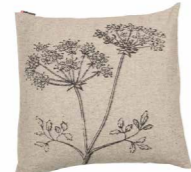
8233 | 98 50 x 50 cm (S. / P. 19)