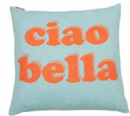
8227 | 57 50 x 50 cm (S. / P. 5)