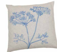
8233 | 22 50 x 50 cm (S. / P. 18)