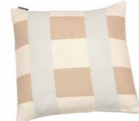
8232 | 80 50 x 50 cm (S. / P. 21)