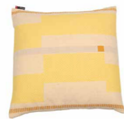
8236 | 30 50 x 50 cm (S. / P. 17)