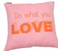
8229 | 10 45 x 45 cm (S. / P. 11)