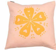
8230 | 72 50 x 50 cm (S. / P. 13)