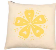
8230 | 30 50 x 50 cm (S. / P. 13)