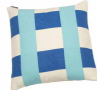
8232 | 22 50 x 50 cm (S. / P. 20)