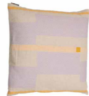
8236 | 41 50 x 50 cm (S. / P. 16)